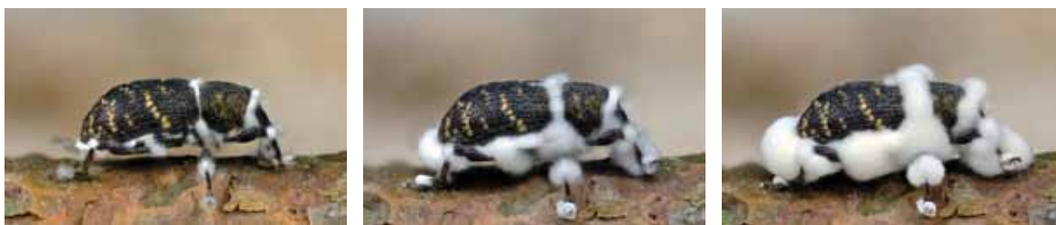
Obrázok 1. Stupne prerastania imága tvrdoňa hubou (3. až 5. stupeň) Figure 1. Degrees of overgrowth of pine weevil adult by fungus (3. to 5. degree)